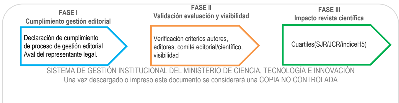
Gráfica 2 Representación de las fases del proceso de evaluación de revistas científicas

A continuación, se describen cada una de las tres fases contempladas en el proceso de evaluación. El cumplimiento de los requisitos definidos para cada una de éstas es obligatorio tanto para revistas indexadas, como para aquellas que se encuentre en proceso de indexación, con el fin de avanzar a la siguiente fase (ver gráfica 2):