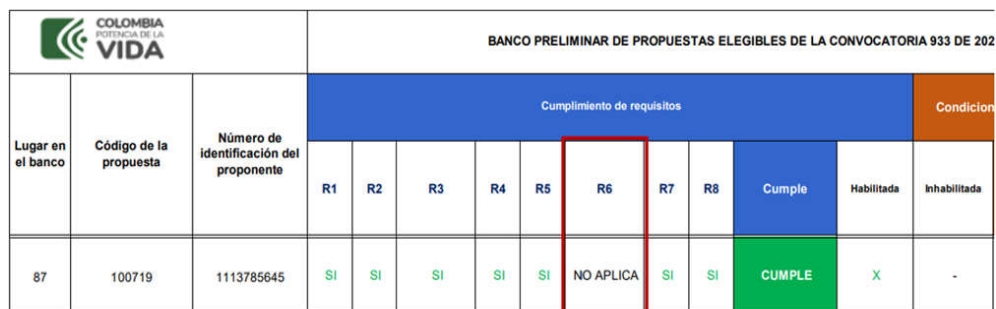
Figura 3. Reporte cumplimiento requisitos de la propuesta 100719 publicado en el banco preliminar